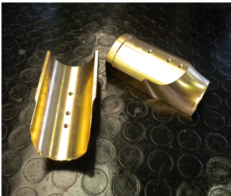
Utensili per curvatubi

Le leghe CONCAST® 954 e 959 sono utilizzate per la realizzazione di utensili per la curvatura/piegatura del tubo.