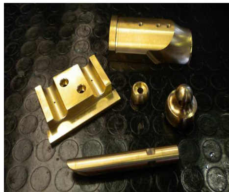
utensili per curvatubi